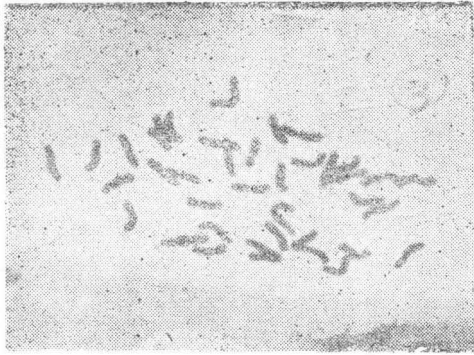
图 1. 马蔺根尖体细胞中期, 示 2n=40