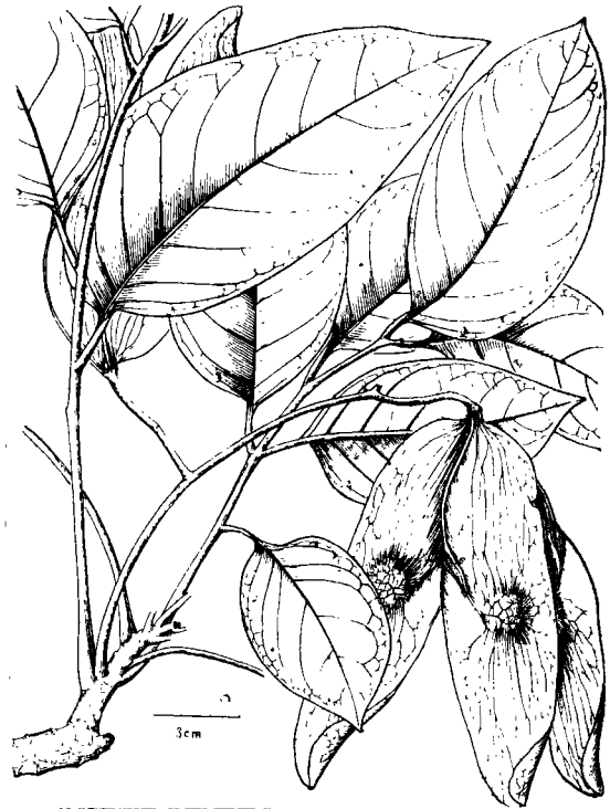
图2 广西樗树 Ailanthus guangxiensis S. L. Mo 果枝。