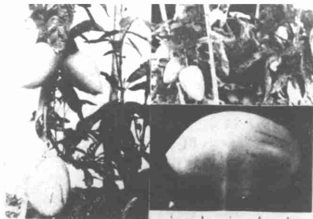
图1 香瓜梨田间生长结实与果的外观 Fig. 1 The fruiting and shap of Solanum muricatum Ait. in the field

本研究借用张兰英 (4) 的配方, 经过改良制备培养基, 观察叶片愈伤组织的形成。叶片有取材方便的特点, 提高繁殖频率。首先需经过脱分化阶段, 再由愈伤组织诱导分化成丛生不定芽。选用了前述4种培养基, 结果见表1。从表1可以看出, 4号培养基的诱导频率虽