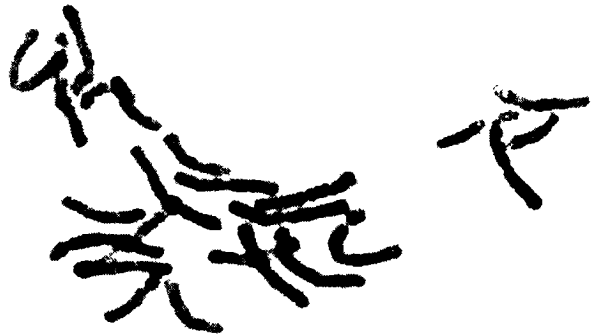
图 1 青岩油杉体细胞染色体

油杉属植物我国有 9 种, 现已知做了染色体研究的有黄枝油杉( K. calcarca Cheng et L. K. Fu), 矩鳞油杉( K. oblonga Cheng et L. K. Fu), 江南油杉( K. cyclolepis Flous), 铁坚杉( K. davidiana )和台湾油杉( K. davidiana var. formosana ) [3, 4] , 根据郑万钧和傅立国 [5] 的观点, 青岩油杉与台湾油杉都是铁坚杉的变种, 3 种油杉的核型类型如表 2 所示, 由表中可见, 3 种油杉的染色体长度比、臂比大于 2 的染色体比例以及核型不对称系数均有差异, 而且都是台湾油杉>青岩油杉>铁坚杉, 这表明 3 种油杉的对称程度为铁坚杉>青岩油杉>台湾油杉。根据 Stebbins [7] 所阐述的植物核型进化的一般规律, 即由对称核型向不对称核型发展; 在 3 种油杉中, 铁坚杉较原始, 台湾油杉较进化, 从我国油杉的分布来看, 大多数的种类分布于我国的中部和西南部, 台湾油杉为分布南沿的一个种。将铁坚杉、青岩油杉和台湾油杉的分布作一比较, 从北至南的顺序