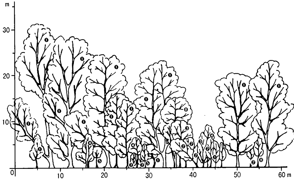
图 1 四籽柳群落垂直结构图

该群落分布在勐宋海拔 1 680 m 的地带, 其生境特点主要表现为: 山区较宽的山间沟谷为长流水溪沟, 水湿条件较好; 群落内树上附生大量苔藓植物; 地面枯落物层较厚, 土壤为黑色沉积沙壤土, 土壤较湿润; 沿山间沟谷小溪呈带状分布, 几无人影响。