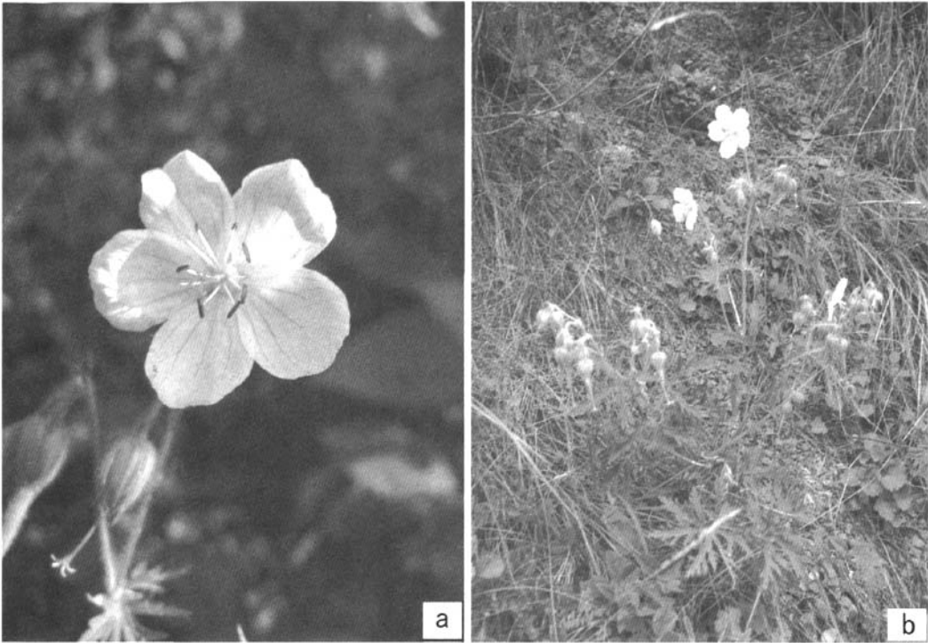
图1 白花草地老鹳草

Fig. 1 Geranium pratense L. f. albiflora Q. Zhu et J. Wang