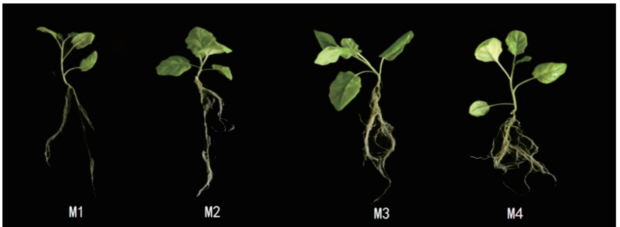
图 3 不同浓度 IBA 对托鲁巴姆单芽茎段生根的影响

Fig. 2 Effects of different concentrations of KT and IBA on the secondary proliferation of Solanums torvum stem segment