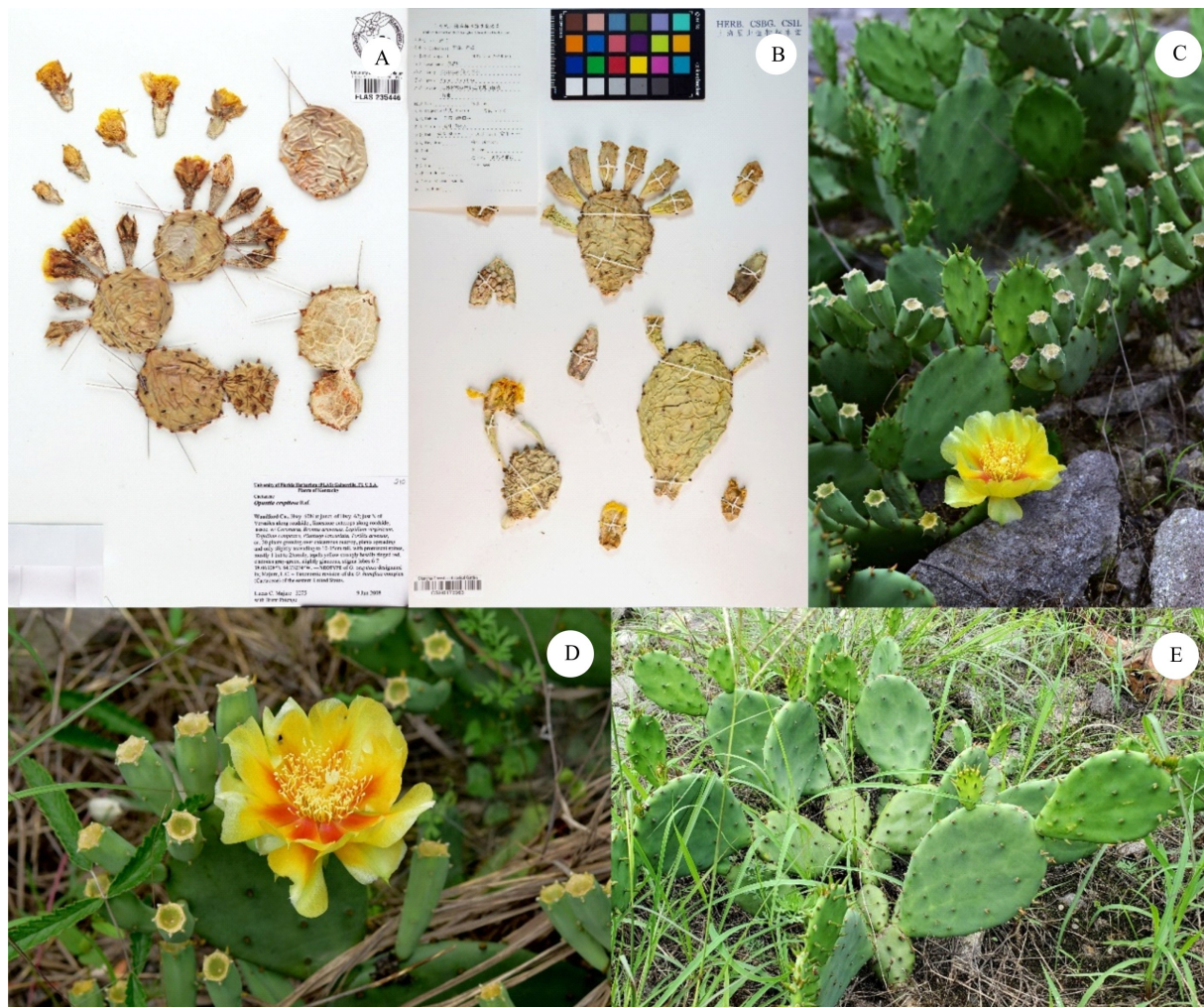
A. 二色仙人掌模式标本; B. 江苏产二色仙人掌凭证标本; C-E. 江苏产二色仙人掌叶状茎、花及植株(小窠内无针状刺)。 A. Neotype of O. cespitosa ; B. Voucher specimen of O. cespitosa found in Jiangsu Province; C-E. Cladodes, flowers and plants (no spines in the areole) of O. cespitosa found in Jiangsu Province.