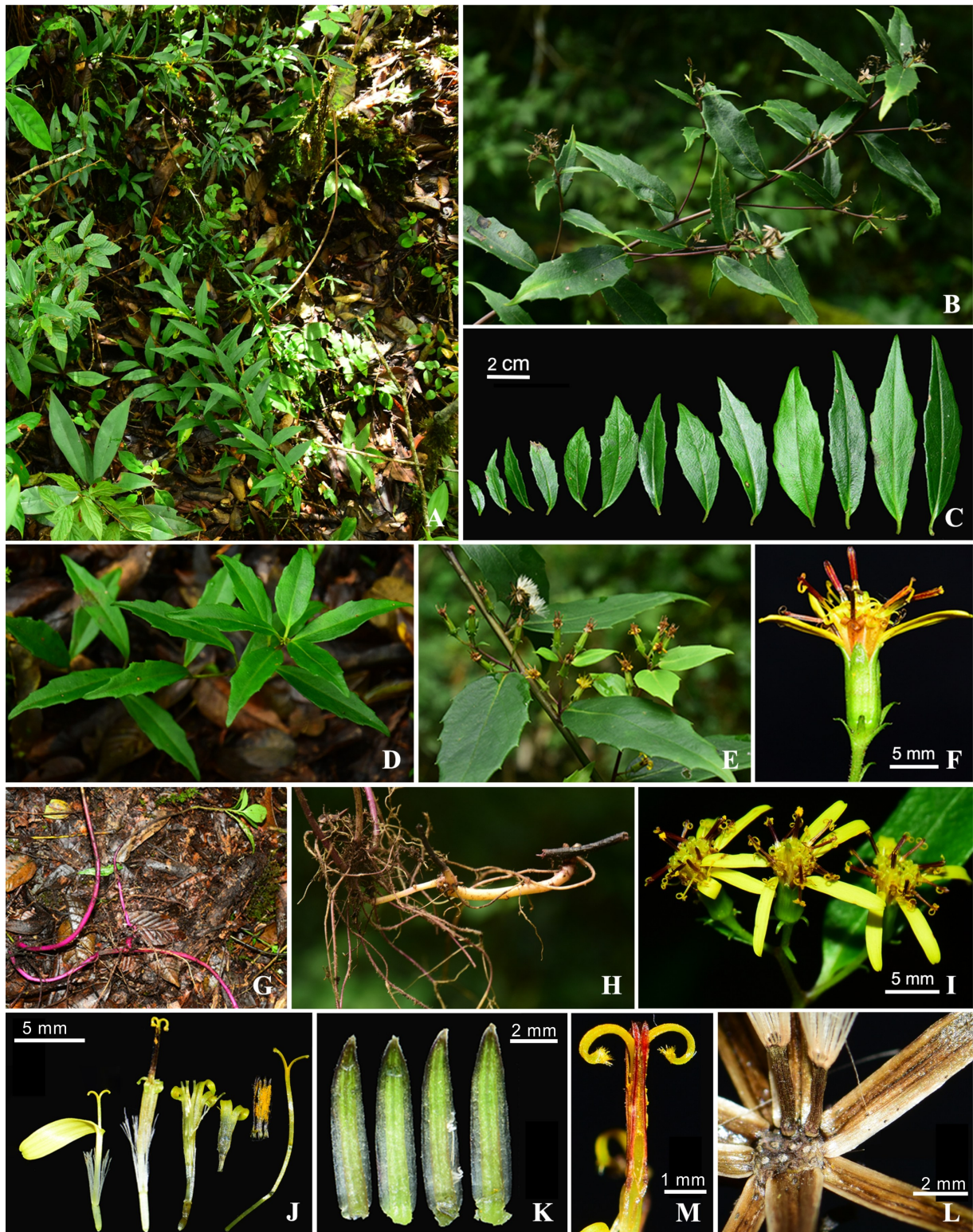
A. 植株生境; B. 植株上部; C. 叶形比较; D. 幼苗; E. 腋生花序; F. 头状花序侧面; G. 有幼苗的横走地下茎; H. 须状根; I. 头状花序正面; J. 舌状花、管状花及解剖的管状花; K. 部分苞片正面; M. 雄蕊与柱头; L. 花盘与瘦果。 A. Habitat; B. Upper part of plant in flowering; C. Comparison of leaf shapes; D. Young individual; E. Inflorescence in upper leaf axils; F. Capitulum in lateral views; G. Subterraneous rhizome; H. Fibrous roots; I. Capitulum in frontal views; J. Ray floret, whole and dissected disc florets; K. Abaxial surface of partial phyllaries; M. Stamens and style of disc floret; L. Ripe achenes attached to receptacle.