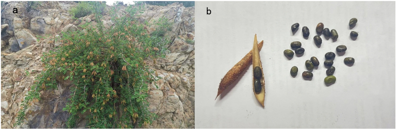
图 1 丽豆植株 (a) 及种子 (b) 照片