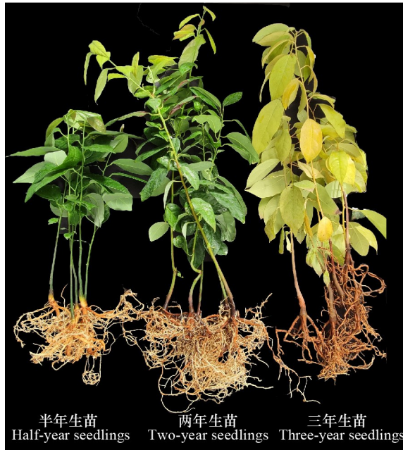
图 1 试验用蒜头果幼苗的形态特征