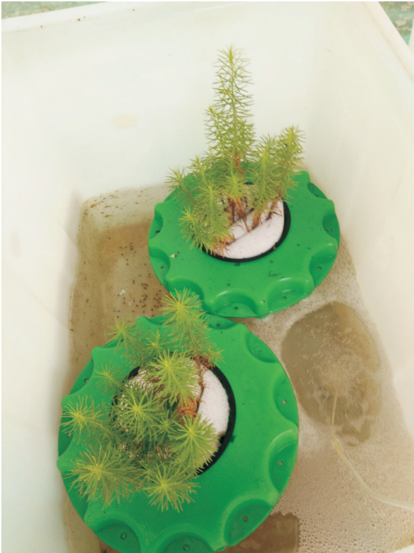
图1 实验装置 Fig. 1 Experiment device