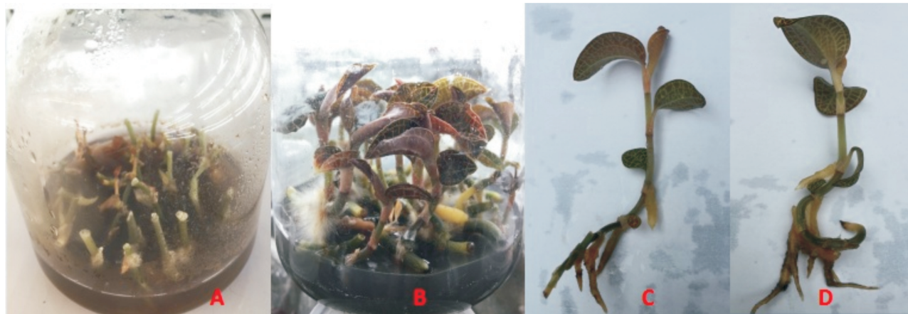
Fig. 2 Cultivating strong seedling and inducing root of Guangxi Anoectochilus roxburghii in the medium with GA_3

注: A. 竖直接种培养 10 d; B. 水平接种培养 60 d; C. 竖直接种培养 90 d 的单株苗; D. 水平接种培养 90 d 的单株苗。