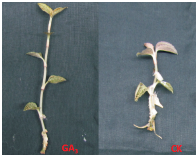
图 2 添加赤霉素 GA_3 培养广西金线莲壮苗生根生长的情况

Fig. 2 Cultivating strong seedling and inducing root of Guangxi Anoectochilus roxburghii in the medium with GA_3