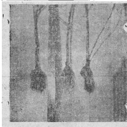
图3 高压枝皮孔根包围土球情况