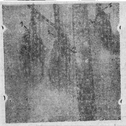
图4 1—皮孔根, 2—愈伤组织根