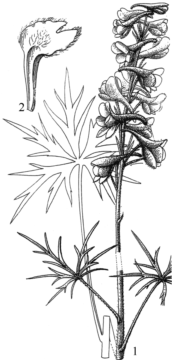
图 12 塔城翠雀花 1. 开花植株上部；2. 退化雄蕊。（引自《新疆植物志》）