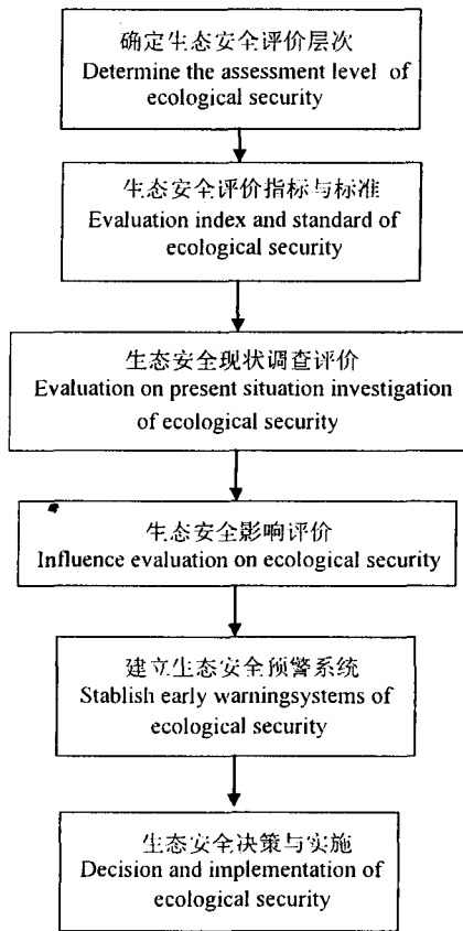
图1 水生外来植物生态安全评价的内容和程序 Fig. 1 Content and program of ecological security assessment of aquatic alien plants

安全性最差,1表示安全性最高;根据各个评价因子的相对重要性赋予其权重;将各个因子的变化值综