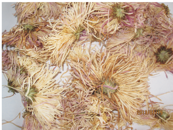
图 1 雪菊样品

1.2.2 挥发性成分分析的条件 色谱条件:Agilent 5973N 气相色谱/四极杆质谱联用仪。色谱柱为 HP-5MS 毛细石英柱(30 m \times 0.25 mm,0.25 \mu m);载气为氦气,载气压力(恒压)53 kPa;恒定柱流量为 1 mL/min;分流比为 20:1;进样口温度 260 °C,接口温度 270 °C。升温程序:初始温度 50 °C,保持