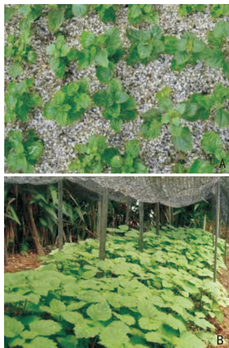
图 3 炼苗 4 周(A)和移栽大田 3 周后的广藿香再生植株(B)