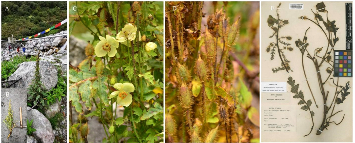
A. 生境; B. 果期植株; C. 刚毛具略紫的黑色基部; D. 果实; E. 主模式标本。 A. Natural habitat; B. Fruiting plant; C. Base of the bristles purplish-black; D. Fruits; E. Holotype.

近似种比较: 通常认为尼东绿绒蒿与细梗绿绒蒿( Meconopsis gracilipes G. Taylor)最为相近(吴征镒和庄璇, 1980; Grey-Wilson, 2014; Yoshida, 2021),根据相关文献、标本整理了两者主要差别(表 1)。